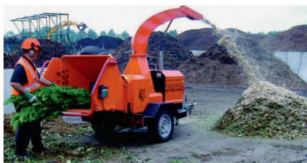
Timberwolf Shredder S 426 auf dem Kompostplatz

Timberwolf ist mit einem Marktanteil von über 60% absolut führend auf dem Heimmarkt. Das Unternehmen stellt seit 1984 qualitativ hochwer-