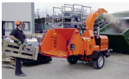
Timberwolf Shredder S426 beim Shreddern von Paletten und anderem Abfallholz.