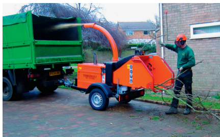
Timberwolf Holzacker TW 150 auf Grünabfuhr